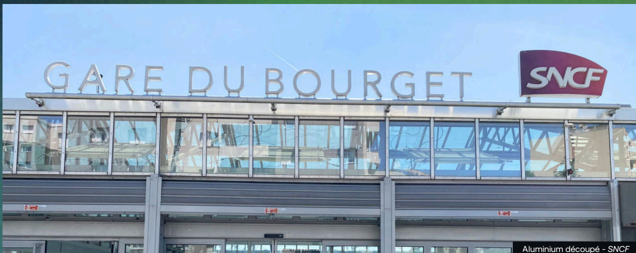
Aluminium découpé - SNCF