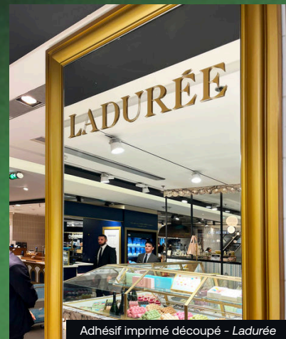
Adhésif imprimé découpé - Ladurée