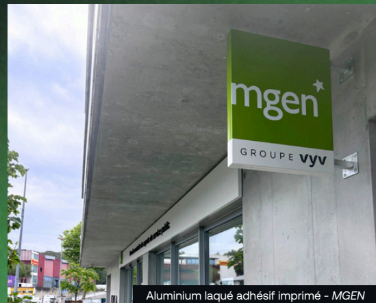
Aluminium laqué adhésif imprimé - MGEN