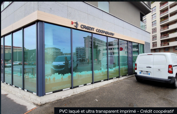
PVC laqué et ultra transparent imprimé - Crédit coopératif

Créer des environnements lisibles, cohérents et engageants, qui participent à la qualité d'accueil et à l'appropriation des espaces.