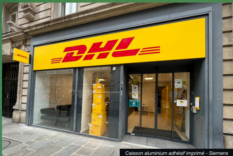
Caisson aluminium adhésif imprimé - Siemens