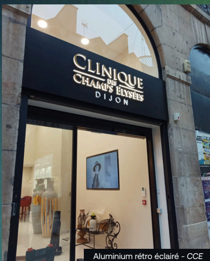
Aluminium rétro éclairé - CCE