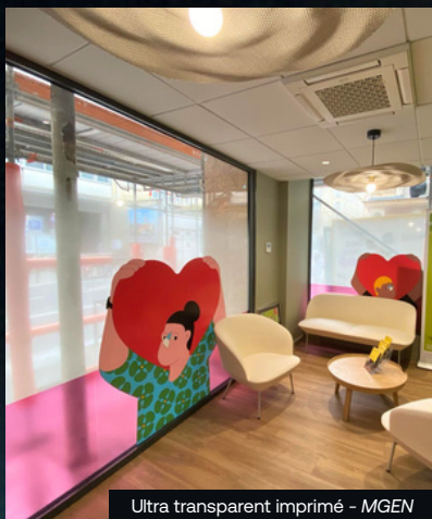
Ultra transparent imprimé - MGEN