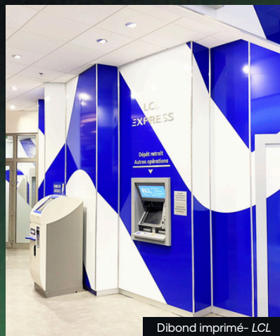
Dibond imprimé- LCL